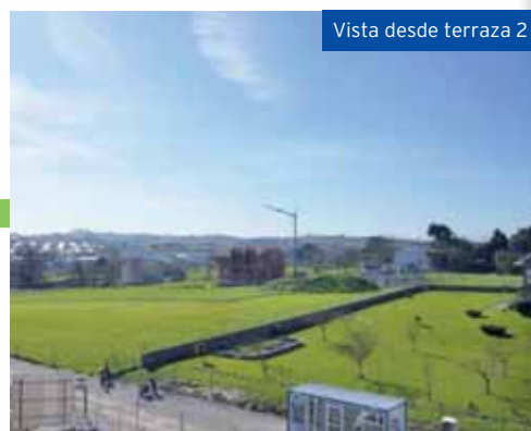
Vista desde terraza 2